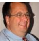
Ordförande för Socialdemokraterna Tjörn och Kommunfullmäktigeledamot

Äldreomsorgen i Sverige har under hundra år utvecklats från fattigvård och undantagsstugor till en lagstyrd verksamhet som bygger på en nationell värdegrund. 1981 kom Socialtjänstlagen och vi skapade en socialtjänst som skulle ge ... läs mer